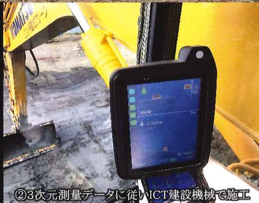
②3次元測量データに従いICT建設機械で施工