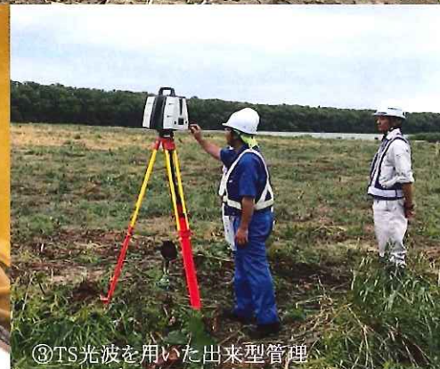
③TS光波を用いた出来型管理

日時：令和元年9月27日(金) 9:30-16:50 (見学会9:30-12:30 講演会13:30-16:50 交流会17:15-18:45)